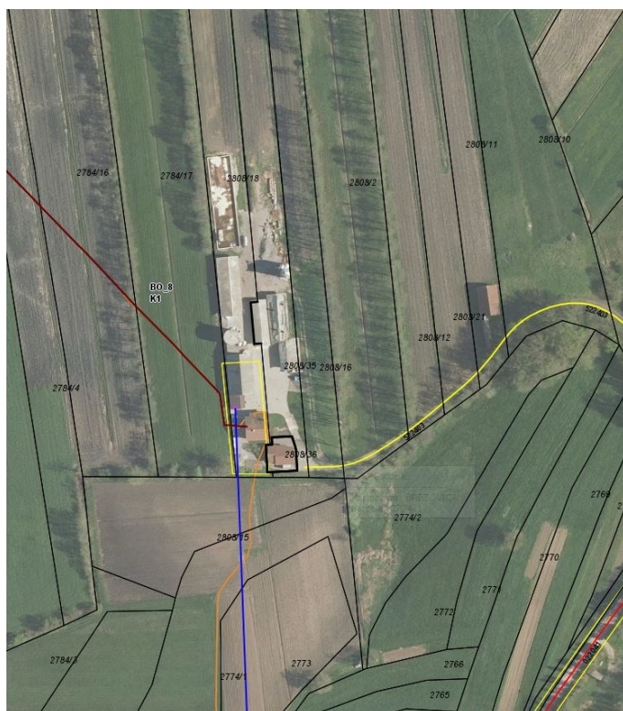
Slika 4: Gospodarska javna infrastruktura na širšem območju predvidenega OPPN (rumena linija – meja EUP; debelejša rumena linija – javna pot; rdeča linija – elektroenergetsko omrežje; modra linija – vodovodno omrežje; oranžna linija – TK omrežje).

Območje OPPN ima možnost priključitve na obstoječo gospodarsko javno infrastrukturo: do območja poteka elektroenergetsko omrežje, vodovodno in kanalizacijsko omrežje sanitarnih odpadnih voda. Padavinske odpadne vode se uredijo s ponikanjem preko lovilcev olj. Drugo komunalno in tehnično opremo bo investitor zagotavljal samooskrbno v sklopu tehnološkega procesa v skladu s 157. in 160. členom ZUreP-3 ter predpisi, ki urejajo varstvo okolja (nepropustna izvedba hleva, gnojišča, rezervoarja za gnojevko in gnojnico ipd.).