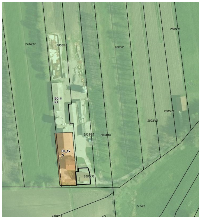
Slika 1: Izsek podrobne namenske rabe prostora iz OPN Občine Brezovica (iObčina, maj 2023).

Investitor je lastnik kmetije v naselju Podplešivica. Na kmetiji se ukvarjajo z rejo prašičev in prodajo mesa. V prihodnje načrtujejo razvoj kmetije. Območje kmetije (slika 1) je z OPN Občine Brezovica (Uradni list RS, št. 23/16, 48/16 – obj., 63/16 – obj., 41/17 – ugot. skl., 2/18 – obj. raz. in 156/22) opredeljeno z EUP PD_15 s PNRP A (površine razpršene poselitve) ter EUP BO_8 s PNRP K1 (najboljša kmetijska zemljišča).