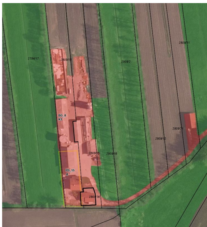
Slika 3: Dejanska raba na območju predvidenega OPPN (rumena linija = meja EUP; rdeča = ID 3000 – pozidano in sorodno zemljišče; oranžna = ID 1222 – ekstenzivni sadovnjak; rjava = ID 1100 – njive in vrtovi; svetlo zelena = ID 1300 – trajni travnik; srednje zelena = ID 1500 – drevesa in grmičevje; temno zelena = ID 2000 – gozd; modra = ID 7000 – voda).

Dejanska raba na obravnavanem območju je preplet pozidanega in sorodnega zemljišča, njiv in trajnih travnikov.