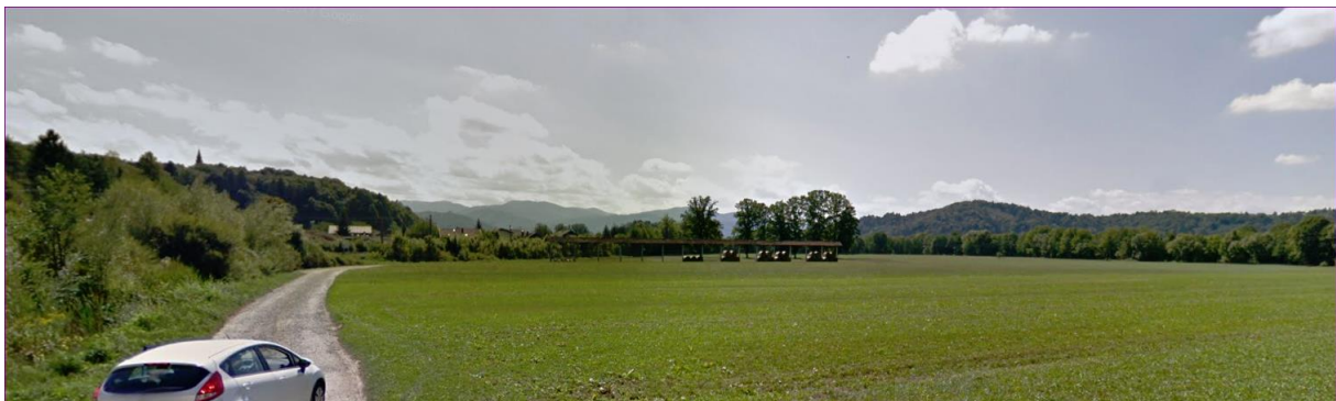
Slika1: fotografija lokacije – potek predvidene obvoznice približno po trasi obstoječe makadamske ceste (potek železnice po nasipu na levi strani).

Poselitev je večinoma umeščena na robove Ljubljanskega barja na rahlo dvignjene lege.