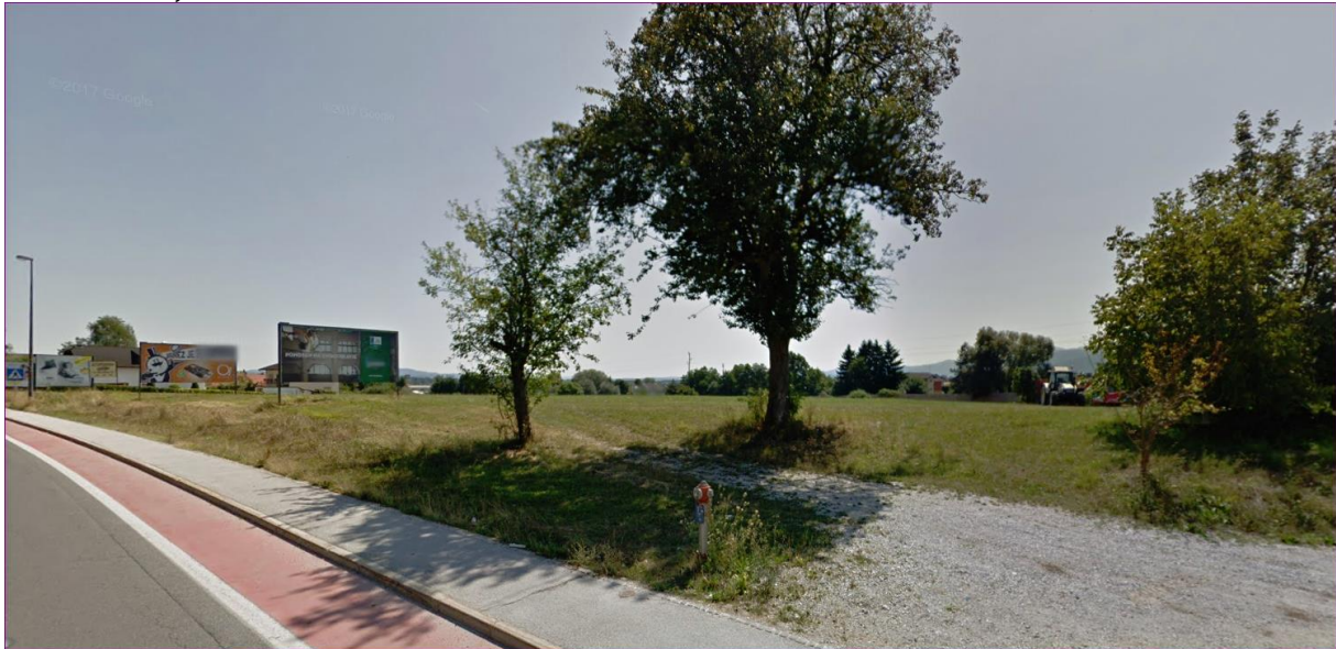
Slika1: fotografija lokacije

Krajinske značilnosti: Območje, glede na Regionalna razdelitev krajinskih tipov v Sloveniji (Marušič in sodelavci, 1998), spada v Krajinsko podenoto 2.2.4.08. Ljubljansko barje z obrobjem. Območje urejanja se nahaja v vzhodnem delu naselja Brezovica. Na severni strani je omejeno z državno cesto Ljubljana – Vrhnika, na južni strani pa z avtocesto. Območje predvidene širitve predstavlja zaključen sklop kmetijskih zemljišč. Na vzhodnem robu mejijo na območje stanovanjskih hiš, na zahodnem pa na kmetijo. Nekoliko širše gledano je lokacija umeščena med površine, namenjene stanovanjski gradnji, na zahodu pa so z novim OPN predvidene površine za centralne dejavnosti.